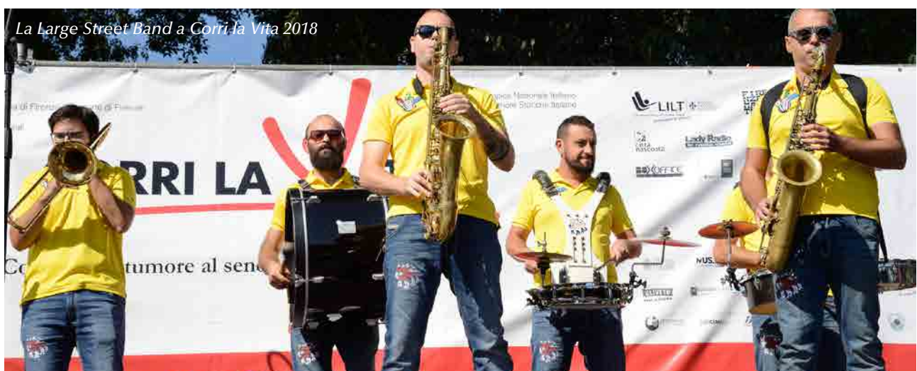
La Large Street Band a Corri-La Vita 2018

In un ambiente così culturalmente fertile, il mio sogno è che la Maratona di Firenze possa sposare un grande evento artistico, per diventare un evento senza precedenti e continui ad essere fucina di campioni sempre più grandi, diventando la prima maratona per partecipanti in Italia!